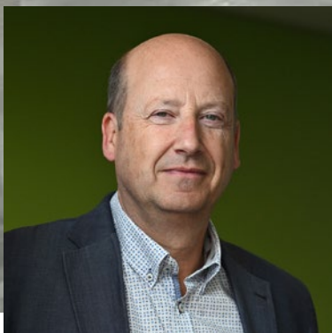
Filip Een unieke aanpak voor uw Bedrijf