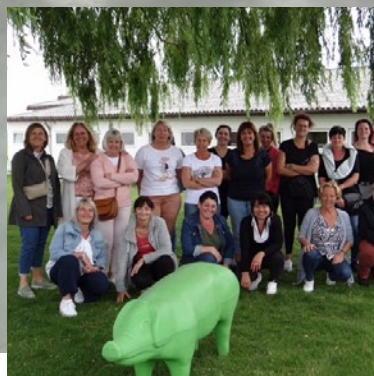
Padeo Zorgen voor een inclusief HR beleid